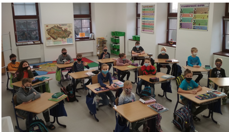
Druhá třída první den ve škole