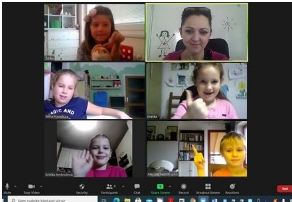
Online výuka v aplikaci ZOOM