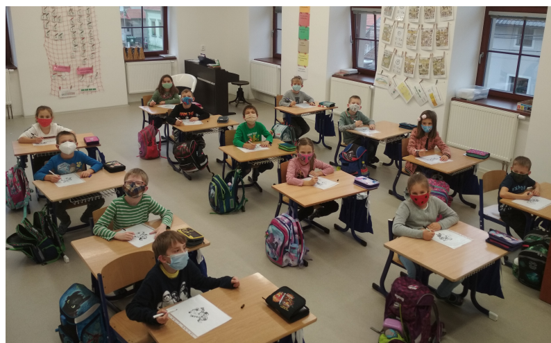
První třída při výuce