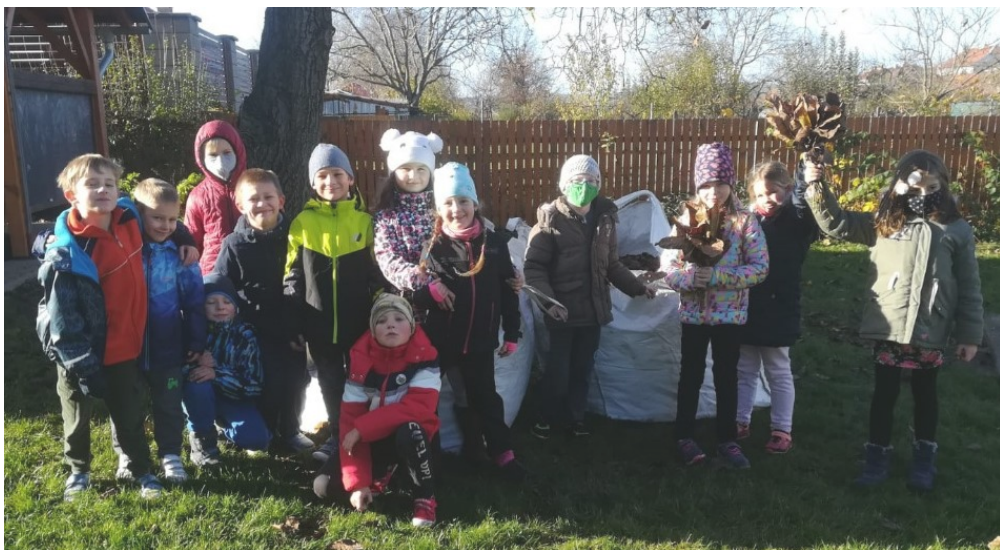
Sběr listů na školní zahradě