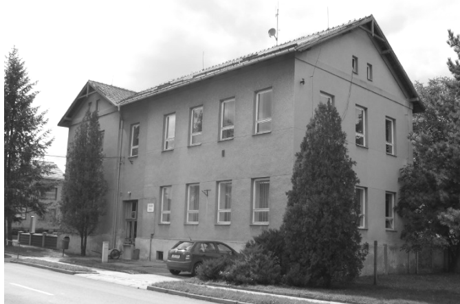
a toto je současnost

Toto jsou jen počátky školství v naší obci. O dalším se můžeme zmínit ještě někdy jindy.