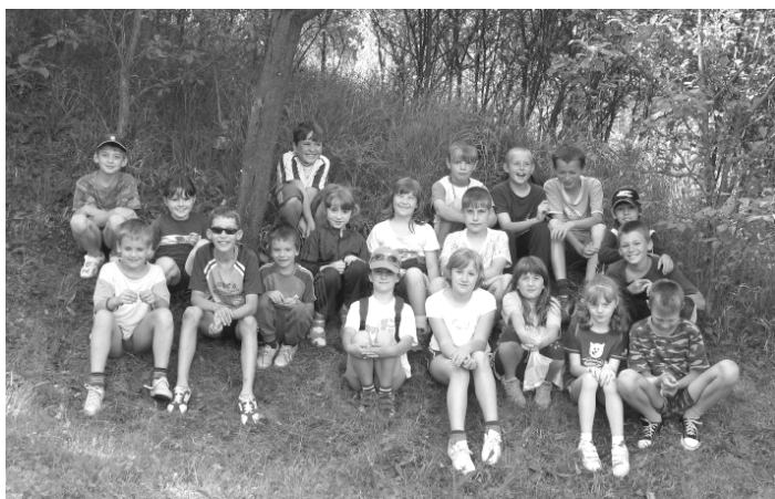
Naše loňská „sestava“ v ZŠ

Školám je ponechána jistá volnost, jak splnění cílů vzdělávání dosáhnout. Školní docházka žáka základní školy je rozdělena do tří období ( 1. – 3. ročník, 4. – 5. ročník, 6. - 9. ročník). Na konci každého období jsou stanoveny tzv. očekávané výstupy, které vyjmenovávají, co má žák umět například po skončení 3. ročníku. Jaké pojetí učiva, jaké formy práce a pracovní postupy škola zvolí, zůstává pak na její volbě.