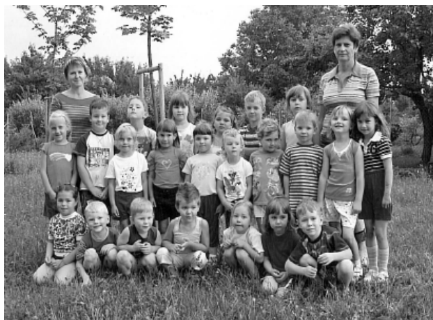
Tak jsme se před prázdninami loučili

Spolupráce všech „zúčastněných“ sice stojí něco úsilí i času, ale jistě se vyplatí.