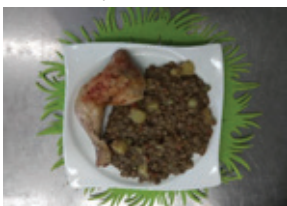
Zeleninový vývar s cuketou a drobením a čočkový Eintopf s pečeným kuřetem