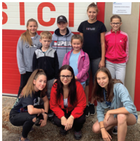
Odjezd na tábor

Po celou dobu jsme si užívali nejrůznějších her, soutěží a úkolů. Nechybělo opékání špekáčků s kytarou, malování táborových triček, oblíbená zumba a přátelská atmosféra, která nás každý tábor doprovází.