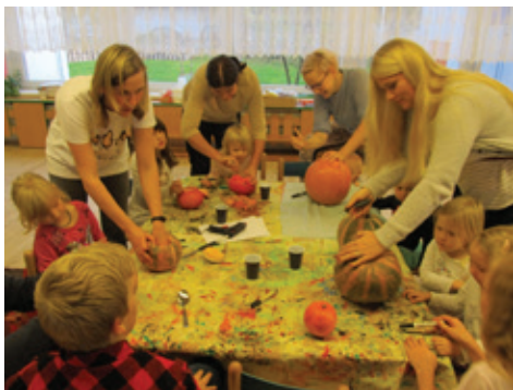
"DÝŇOVÁNÍ" v naší školce